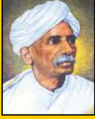
कुलगुरु कै. वि. गं. तथा दादासाहेब केतकर