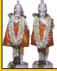
धनुर्धारी श्रीराम लक्ष्मण